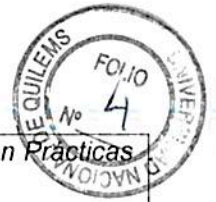
imagen: la era de la imagen electrónica". Conferencia apertura Laboratorio de Investigaciones en Prácticas Artísticas Contemporáneas. Centro Cultural Rojas, Universidad de Buenos Aires.

Catalá Doménech, J. M. (2008), "Capítulo III. Una breve historia de las imágenes", en: La forma de lo real. Introducción a los estudios visuales , UOC Editor. Barcelona.